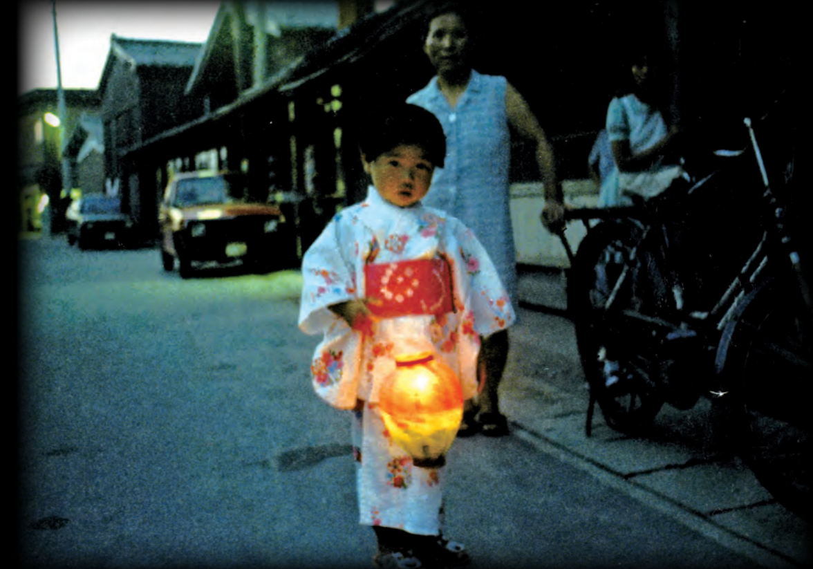
～消えゆく故郷のお盆～

果てしなく広がる 広い、広い、宇宙の中で 地球という、同じ星に生まれた 私たち それだけでも、大きな出逢い 人間の生命 それは宇宙の歴史の中で 一瞬にして消えてなくなる 閃光のようなもの 短くも儚い生命 だからこそ美しく、尊い 我ら 縁あつて、ここに集い そして眠る これぞ、仏の説く「安穩」の世界 私たちは 誓つ 日本海の風 澄み切った夏の陽差しの中で いのちあるかぎり いただいた「ご縁を 大切にすることを