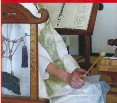
唱題行体験 at 大書院