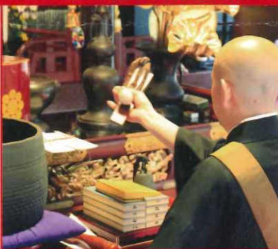
消難お札ご祈祷 at 妙見堂