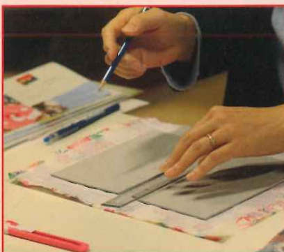
御朱印帳づくり at 本堂