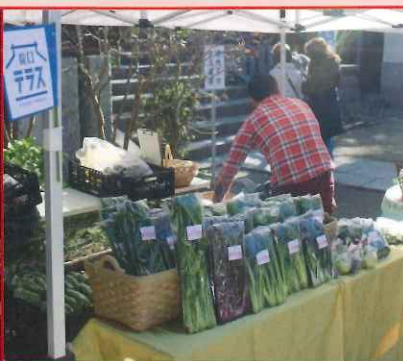
プチマルシェ at 境内