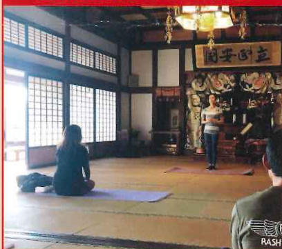
てらヨガ at 大書院