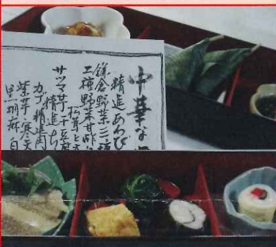
中華精進料理と法話の会